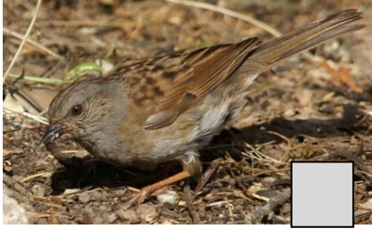
Accenteur mouchet (Fabrice Soulon)