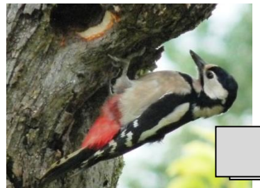
Pic épeiche (Maryvonne Goudinoux)