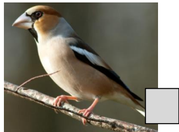
Grosbec casse-noyaux