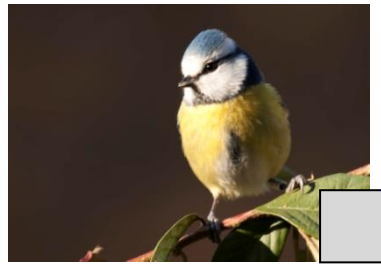
Mésange bleue (Céline Chartier)