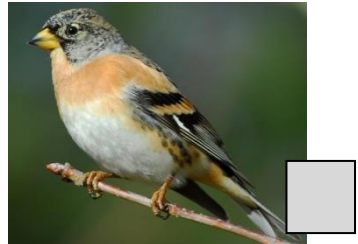
Pinson du Nord