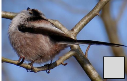
Mésange à longue queue (Ghislaïne Sallot)