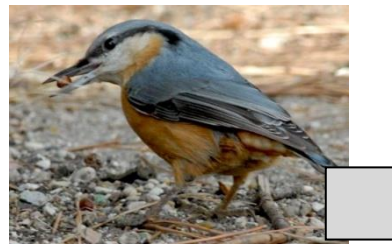
Sittelle torchepot (Danièle Boone)