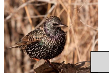
Étourneau sansonnet (Céline Chartier)