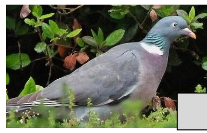
Pigeon ramier (Tom Sorcelle)