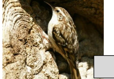
Grimpereau des jardins (Fabrice Soulon)