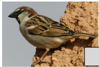
Moineau domestique (Fabrice Soulon)