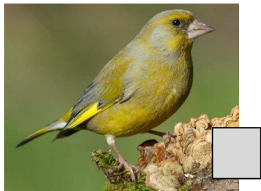
Verdier d'Europe (Thierry Veau)