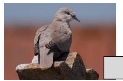
Tourterelle turque (Céline Chartier)