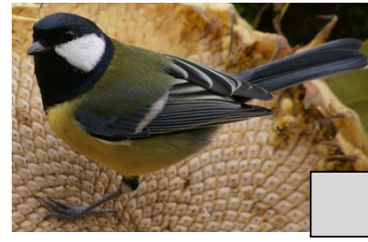
Mésange charbonnière (Fabrice Soulon)