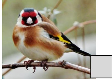
Chardonneret élégant