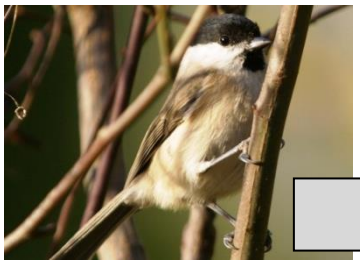
Mésange nonnette (Fabrice Soulon)