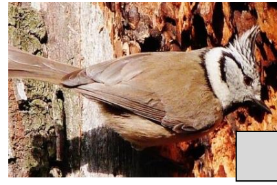
Mésange huppée (Tom Sorcelle)