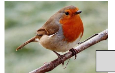
Rougegorge familier