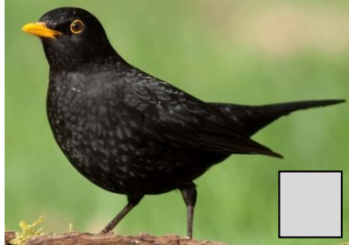
Merle noir