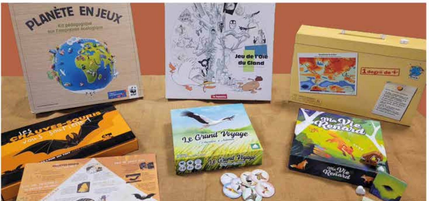
Les jeux de société ludiques !