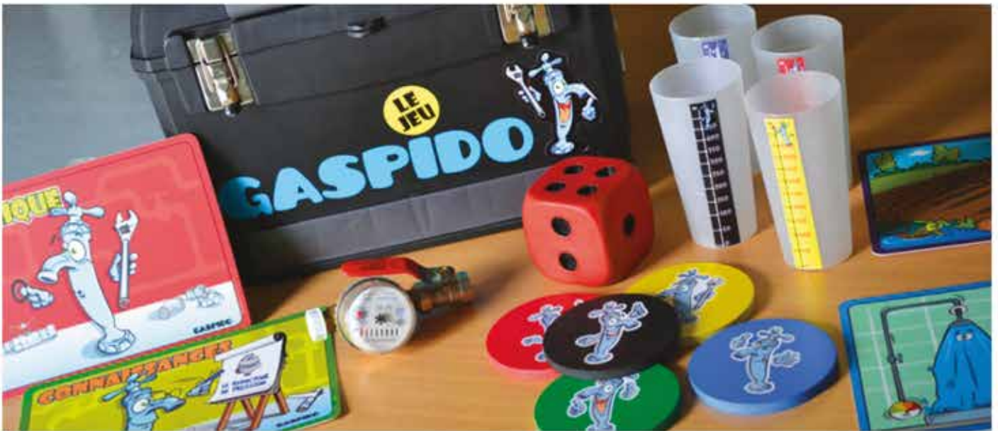
La malle Gaspido pour apprendre à économiser l'eau !

Ces supports pédagogiques peuvent être loués ou prêtés pour que vous organisiez vous-même une activité ou un événement. N'hésitez pas à nous contacter pour plus de renseignement.