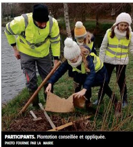
PARTICIPANTS. Plantation conseillée et appliquée.

l'étang, trois invités surprises les attendaient. Trois chevreuils qu'ils ont pu