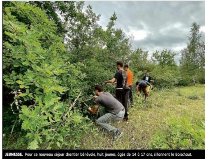
JEUNESSE. Pour ce nouveau séjour chantier bénévole, huit jeunes, âgés de 14 à 17 ans, sillonnent le Boischaud.

Un séjour de dix jours, jusqu'au 27 juillet, que Nature 18 porte depuis une quinzaine d'années et durant lequel ces adolescents partent à la découverte de la biodiversité du Boischaud. « Les activités du matin concernent principalement des