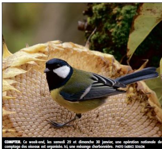
COMPTER. Ce week-end, les samedi 29 et dimanche 30 janvier, une opération nationale de comptage des oiseaux est organisée. Ici, une mésange charbonnière.

ce comptage, auquel le Cher participe depuis dix ans. « L'idée, c'est d'offrir une photographie du nombre d'oiseaux en hiver, poursuit Sébastien Brunet. Selon que l'hiver est froid