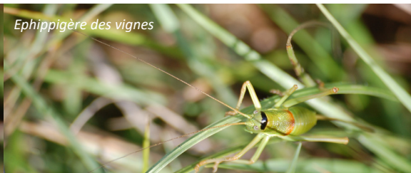
Ephippigère des vignes